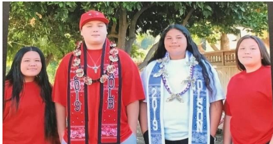
Några av mina släktingar

Detta i sin tur gör att indianer i området har gratis utbildning och hälso- och sjukvård. Luiseno-indianerna finns bara i Kalifornien där de upptäcktes första gången på 1600-talet. De är idag drygt 10 000 personer.