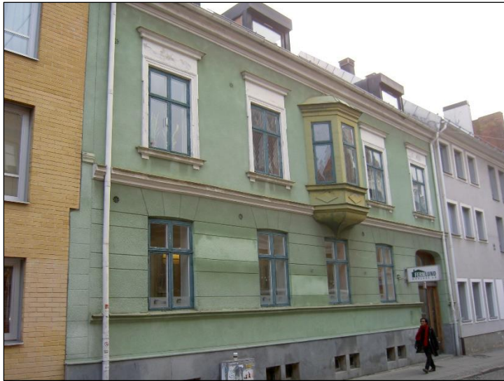
Grönegatan 7, fasad mot gatan