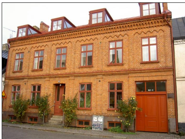
Stora Tvärgatan 5, fasad mot gatan