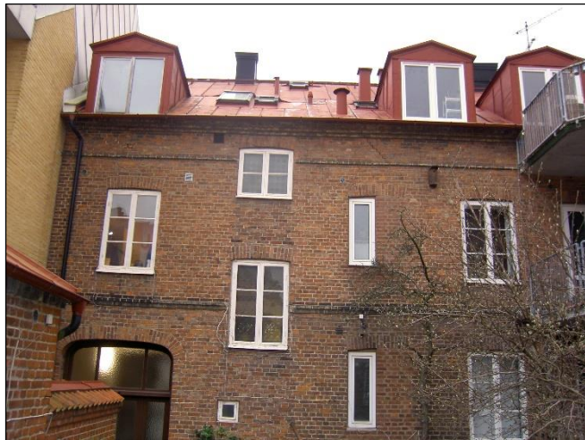
Grönegatan 7, fasad mot gården