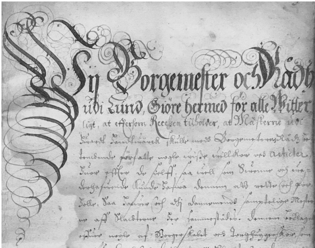
Ur Lunds slaktareämbetets skråordning 1669.