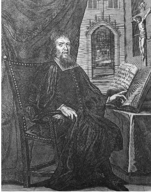
Jesper Swedberg (1653-1735), teologie doktor, biskop i Skara från 1702 och eforus över de svenska församlingarna i England och Nordamerika; kopparstick i Svenskt Pantheon (1906)