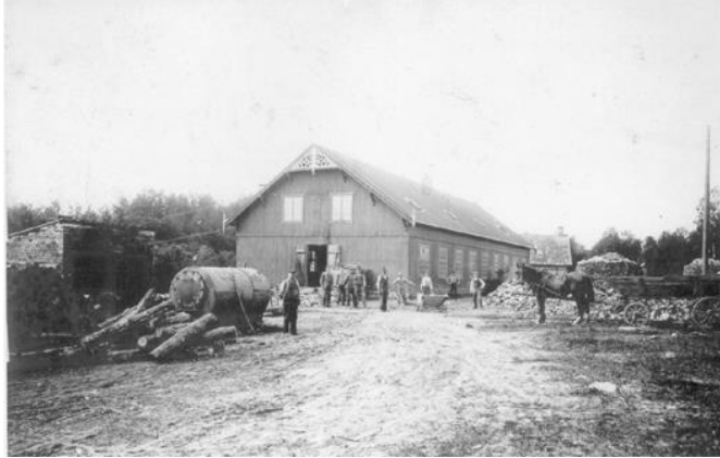
Foto nummer tre var på en utomhusarbetsplats, taget på ett sådant avstånd att ingen av personerna gick att urskilja. Muntlig tradition hade talat om för oss att fotot måste vara från Tyringetrakten i norra Skåne. Efter mycket funderande och en del släktforskning tog jag kontakt med en journalist och även god vän på tidningen Norra Skåne. De båda tidningsblänkarna får tala för sig själv: