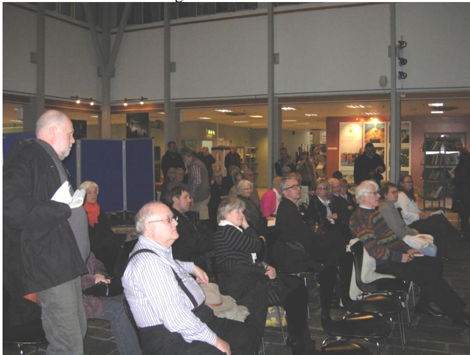
Åhörarna till föredragen börjar samlas.