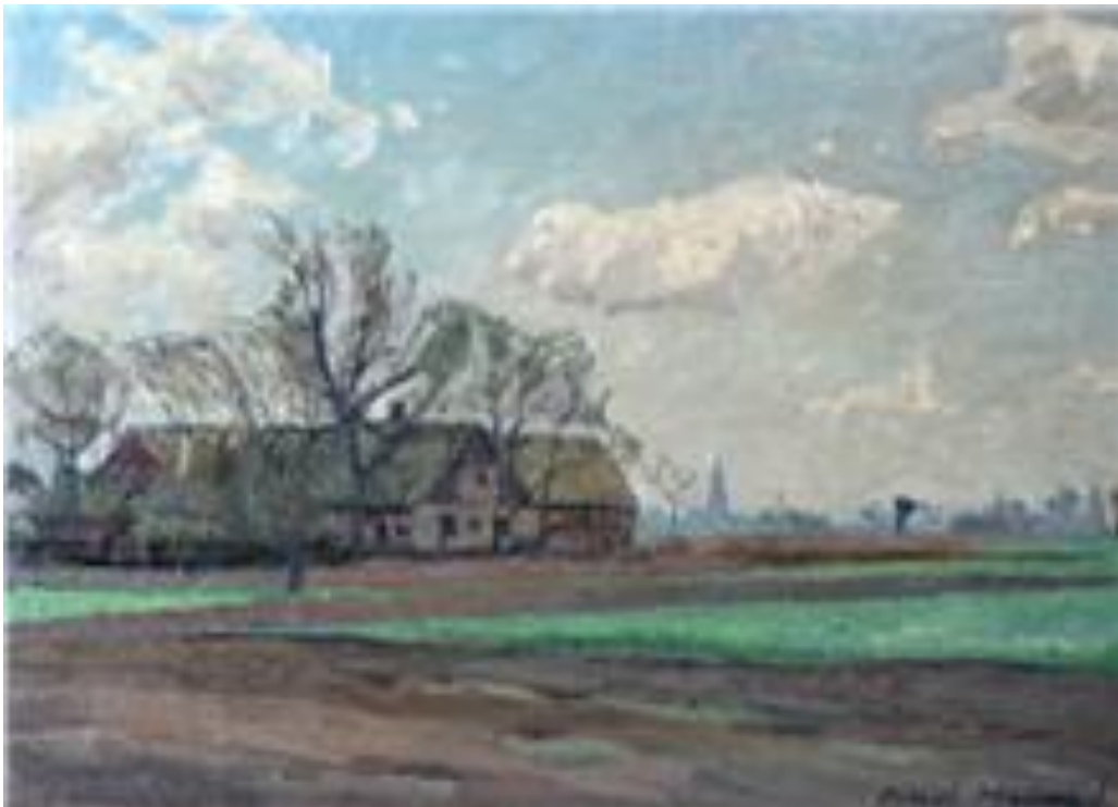
Norra Nöbbelöv nr 3

Om intresse finns fortsätter vi arbetet i höst. Vi välkomnar nya deltagare som kan ta sig an de andra gårdarna. Det finns många fler handlingar, som man kan hitta uppgifter i, så projektet är på inget sätt avslutat.